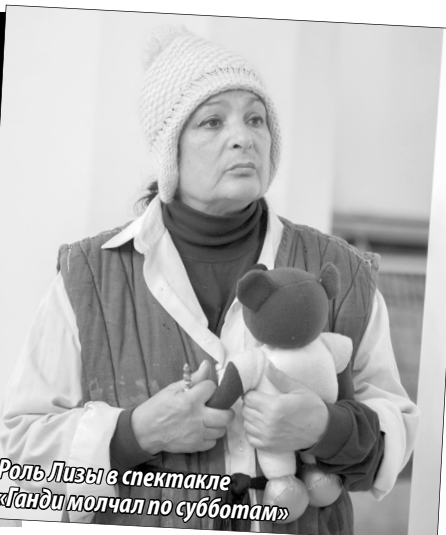
Роль Лизы в спектакле «Ганди молчал по субботам»

достойные и красивые... Сейчас просто: девочки, мальчики, а тогда – герой социальный, герой драматический, герой-любовник. Я посмотрела на них и опять про себя подумала: «Что я тут буду делать?! Как мне сюда вписаться?»