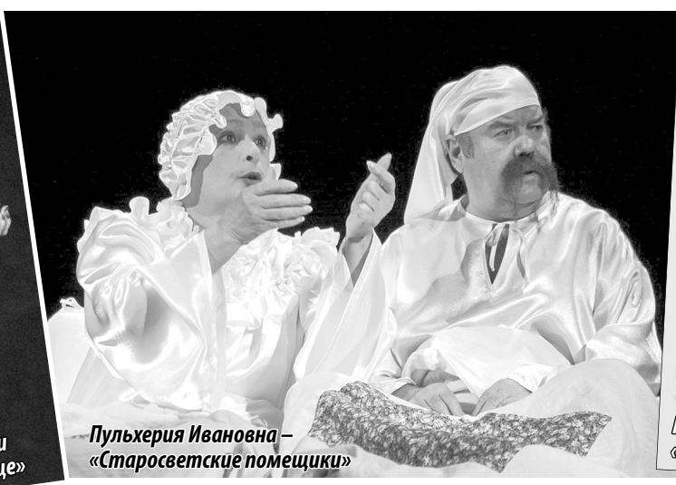
Пулхерия Ивановна – «Старосветские помещики»